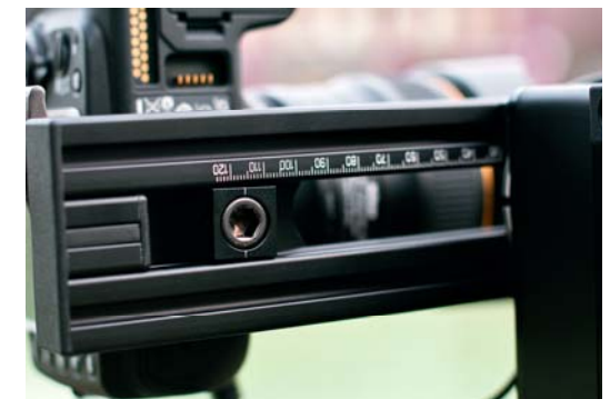
Ist der exakte Nodalpunkt gefunden, lässt sich die Kamera mittels eines kleinen Schlittens fixieren, der im Alu-Profil beweglich gelagert ist. Eine Skala gibt dabei Auskunft über die genaue Position. Einmal ausgemessen, kann man so auch für unterschiedliche Brennweiten den Nodalpunkt schnell wiederfinden.