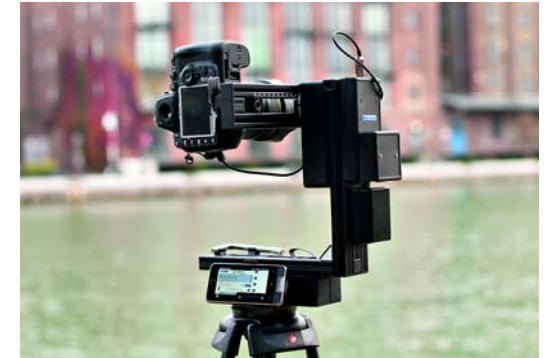
Der aufgebaute Rodeon VR Station CL der Firma Claus. Unten das Smartphone mit der Steuerungssoftware, dahinter der Schrittmotor für die horizontale Drehung. An der Hochkantachse befindet sich der Akku, darüber die Kontrollereinheit mit der Steuerhardware und dem gegenüber der Schrittmotor für die vertikalen Bewegungen. Die Kamera, hier eine Nikon D700, wird per Fernauslösekabel automatisch über die Kontrollereinheit ausgelöst.

Eines merkt man schnell, wenn man sich mit Kugelpanoramen beschäftigt – egal mit welcher Brennweite man fotografiert: Der Standort für das Foto sollte gut überlegt sein: Hat man bei normalen Panoramen den Anspruch, etwas Sehenswertes vor die Linse zu bekommen, muss man bei dieser Art von →