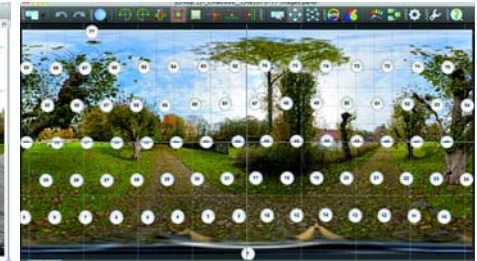
Die Software Autopano Giga vom Hersteller Kolor bietet eine ähnliche Übersicht wie der Panorama Editor von PTGui. Hier können ebenfalls einzelne Bilder ausgewählt und verschoben oder sogar gedreht werden. Auch die Belichtung und die Farben können sehr fein eingestellt werden.