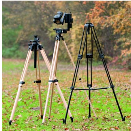
Die drei Test-Stativ von links nach rechts: Das massive Berlebach UNI 17, das zierlichere Berlebach Report 3032 und das große Manfrotto 545B. Die beste Stabilität zeigten das Berlebach UNI 17 und das Manfrotto 545B. Das kleine Report 3032 konnte aber durch kompaktere Packmaße und ein geringeres Gewicht überzeugen. Denn neben der Stabilität ist beim Einsatz im Freien die Fragestellung wichtig, wie weit man das entsprechende Stativ tragen möchte oder kann. Die gesamte Ausrüstung wiegt nämlich schnell an die 10 kg.

→ Bildem daran denken, dass auch unterhalb und oberhalb der Kamera etwas Nettes zu entdecken sein sollte. Das macht die Motivsuche nicht einfacher, aber umso interessanter.