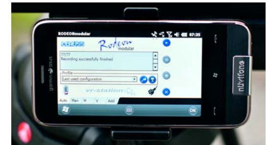
Die Software Rodeon Modular, hier auf dem mitgelieferten Smartphone. Für die Bedienung benötigt man etwas Fingerspitzengefühl, alternativ nutzt man den im Handy versteckten Bedienstift. Die Software ist einfach aufgebaut und man kann mit ein paar Klicks die Anzahl der zu gewinschten Bilder auf der Horizontalen wie auch auf der Vertikalen einstellen. Zusätzlich lassen sich Belichtungsreihen, Wartezeiten bei langen Belichtungszeiten sowie ein Twister-Modus aktivieren, in dem der Kopf für die jeweiligen Fotos nicht anhält.