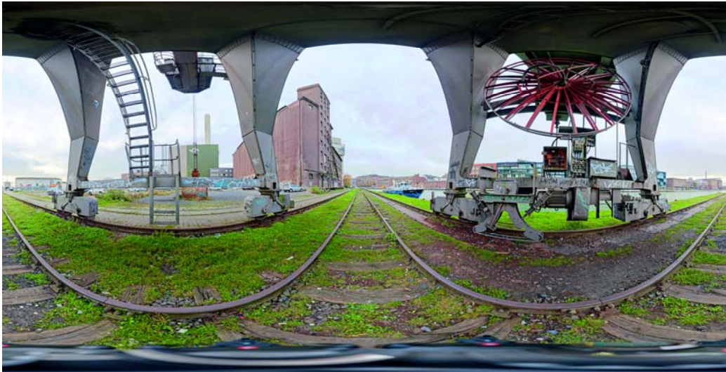
Kugelpanoramen bieten eine verrückte Sicht auf die Welt. Je mehr es in alle Himmelsrichtungen zu entdecken gibt, desto interessanter werden die Bilder.